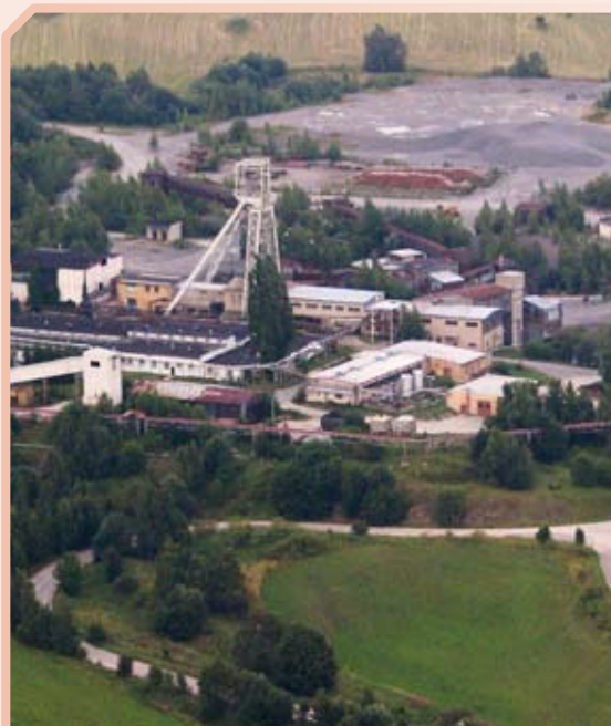
Důl Rožná blízko Žďáru nad Sázavou je posledním hlubinným uranovým dolem ve střední Evropě. Uran se zde těží od roku 1957.

V souvislosti s pokračující těžbou ložiska Rožná se pozornost upírá na ložiska Brzkov a Věžnice, kde v letech 1976–1990 probíhalo vyhledávání uranových rud. Během tohoto období bylo v okolí obcí Polná, Jamné a Brzkov na rozsáhlé části strážeckého oblouku o ploše cca 220 km 2 odvrtno celkem 1641 mapovacích vrtů, vyhloubeno 584 kopaných sond a vykopáno 560 rýh o celkové délce 59 204 m. Perspektivní místa byla ověřena 223 hloubkovými vrty. Lokality Brzkov a Věžnice se nacházejí nedaleko těžebně – úpravarenského komplexu Dolní Rožínka. Těžitelné zásoby uranu