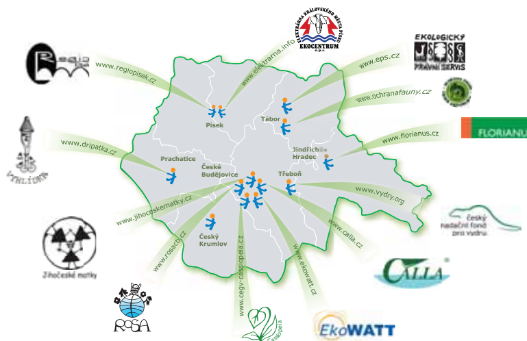
mapa Jihočeského kraje